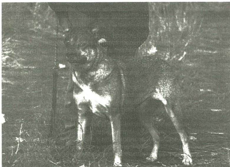
Дора стала самым верным другом

У мужчины нет ни правой, ни левой ладони. Вместо кистей — гладкая круглая культя. Странного красного цвета. Это от холода.