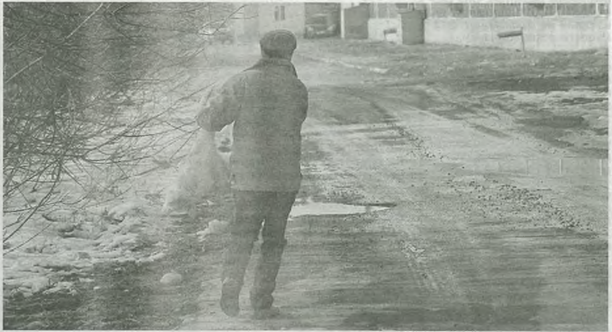
Собаку усыпили смертельным уколом

– Во-первых, свое ружье я никому дать не могу. Все документы оформлены на меня. Вдруг человек, которому я поручу рабо-