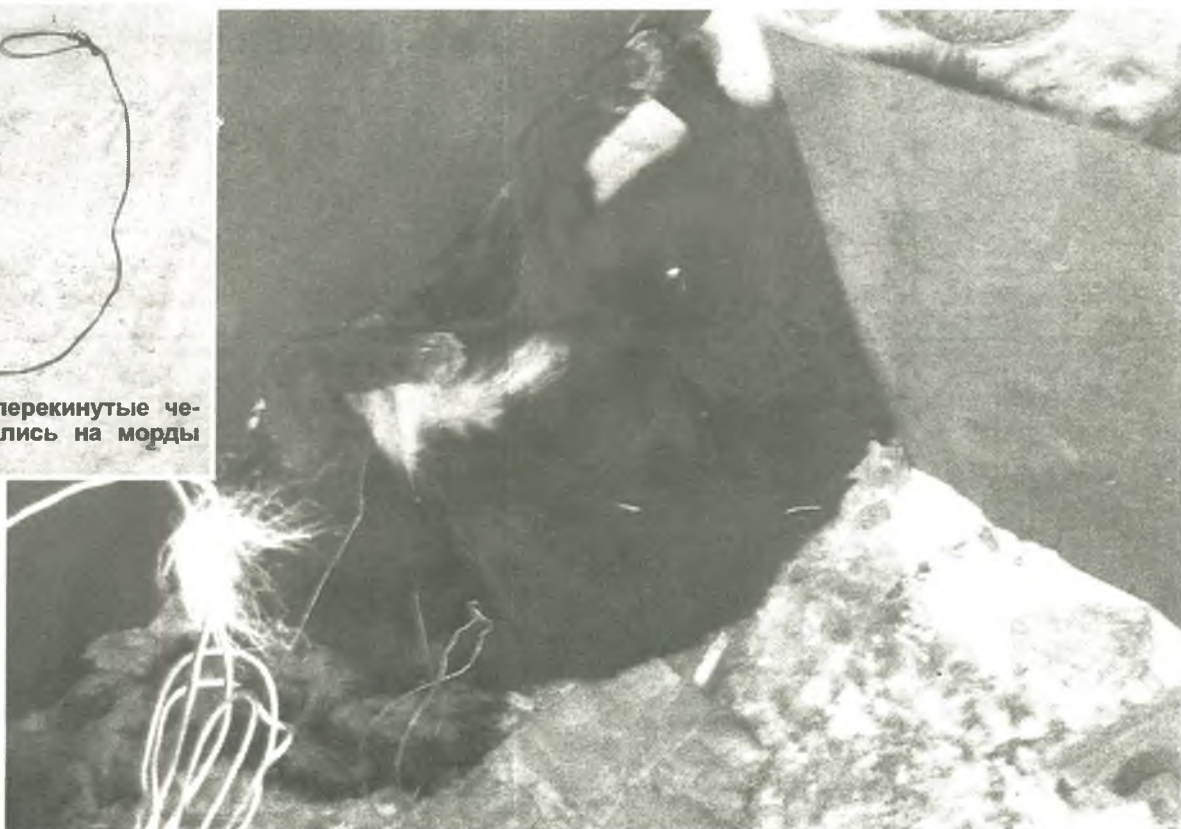
Задушенная проволокой собака и трупик замерзшего щенка

Без какой-либо подстилки, без еды и питья в 30-градусные морозы собаки были обречены на смерть